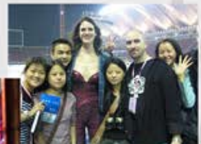
China Tour: Yiwu Arena

"Die Kultband gilt als eine der innovativsten Rockbands Deutschlands..." (Westfälische Rundschau)