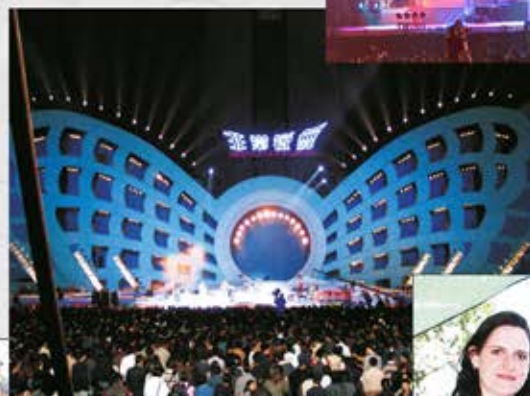
China Tour: Hangzhou Arena

"A sensational concert - an exceptionally gifted band." (ragazzi music/Zappanale)