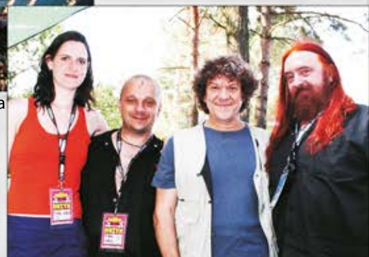
Mit Michael Lang (Gründer Woodstock 69)